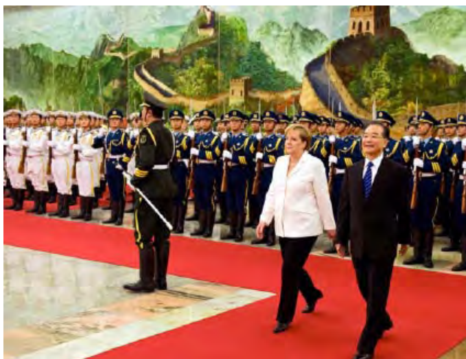
Il cancelliere tedesco Angela Merkel riceve gli onori militari a Pechino nel luglio 2010. Il rilancio del partenariato strategico concordato in questa occasione è alla base del primo summit bilaterale svoltosi nel giugno 2011 a Berlino e destinato a proseguire con cadenza annuale.

In terzo luogo, il governo tedesco non nasconde il proprio interesse ad attrarre gli investimenti cinesi in Europa .