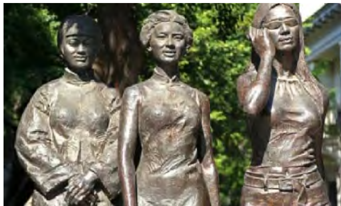
La Cina è stata per l'ultima volta al centro del dibattito internazionale sul ruolo della donna nella società moderna nel 1995, quando la Quarta Conferenza mondiale delle Nazioni Unite sulle donne si svolse a Pechino.